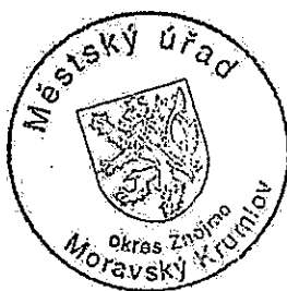
Ing. Pavel Vavřina, tajemník MěÚ Moravský Krumlov

Poučení: Proti tomuto rozhodnutí se mohou ostatní volební strany, které kandidátní listinu podaly, domáhat do 2 pracovních dnů od jeho doručení ochrany u Krajského soudu v Brně (§ 59 odst. 2 zákona o volbách; za doručení se rozhodnutí považuje podle ust. § 23 odst. 4 zákona o volbách třetím dnem ode dne jeho vyvěšení na úřední desce obecního úřadu, který rozhodnutí vydal).